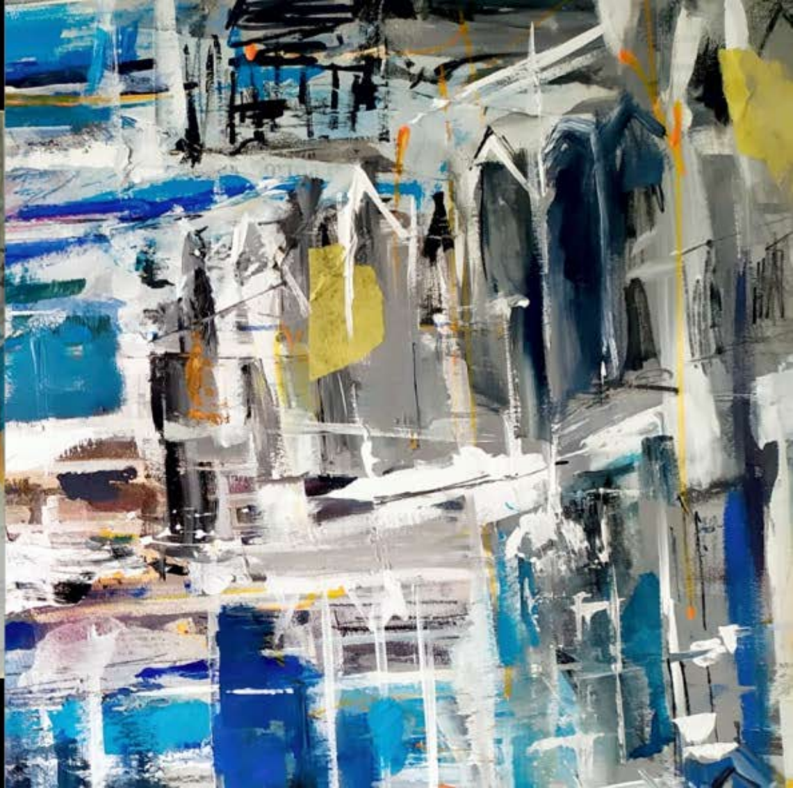
■ "Galerías" Técnica mixta sobre táboa. 75x105 cm.