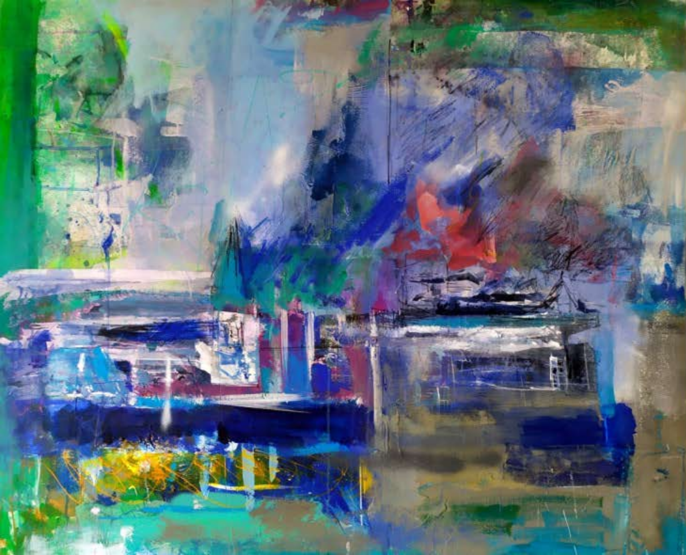
■ "Norte" Técnica mixta sobre lenço. 100 x 120 cm.