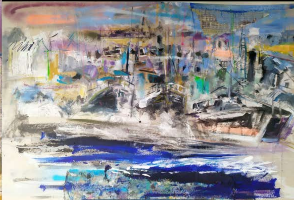
■ "Porto" Técnica mixta sobre cartón pegado a táboa. 80x119 cm.