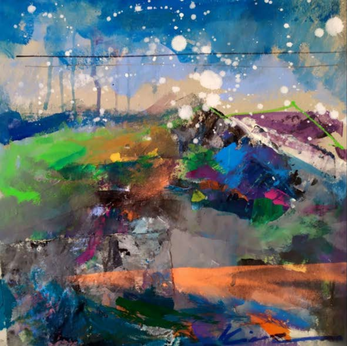
■ "O Pico" Técnica mixta sobre papel. 35x36 cm